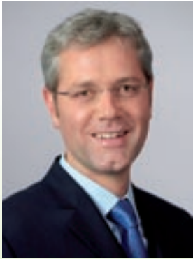
Die Schirmherrschaft des Kongresses hat Bundesumweltminister Dr. Norbert Röttgen übernommen.